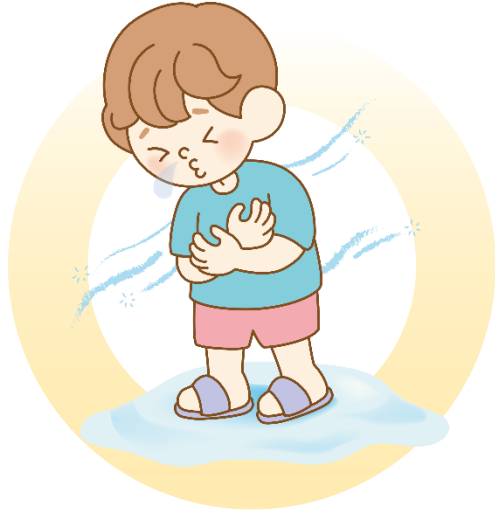
따뜻한 옷을 입지 않았어요