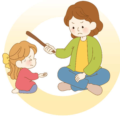
회초리로 아이를 혼내요