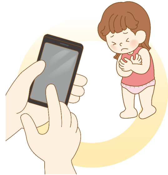
벗은 몸을 촬영해요