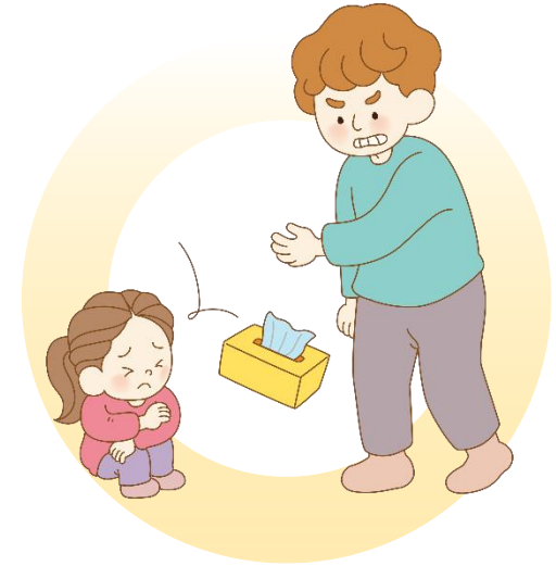
물건을 아이에게 던져요