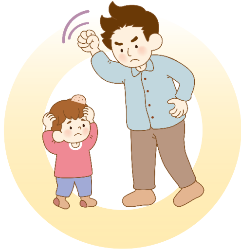
아이의 머리를 손으로 때려요