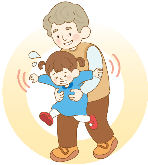
몸을 함부로 만져요