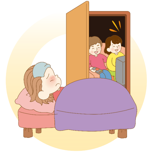
아픈 아이를 돌보지 않아요