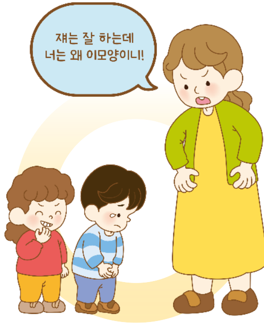
다른 친구와 비교해요