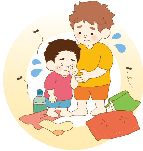
지저분한 환경에서 생활해요