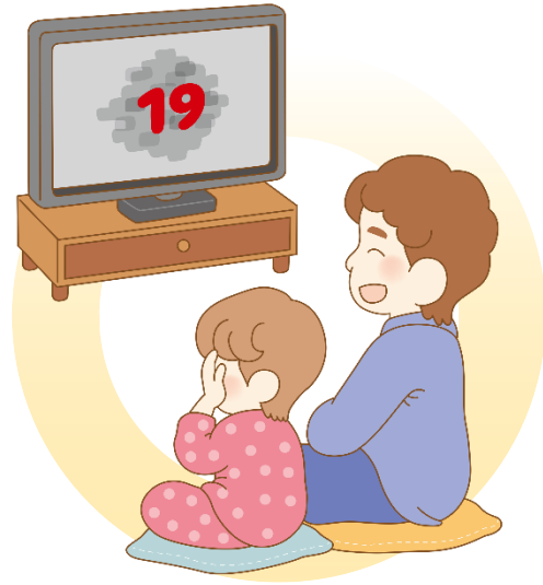
보면 안 되는 야한 영상을 보게 해요