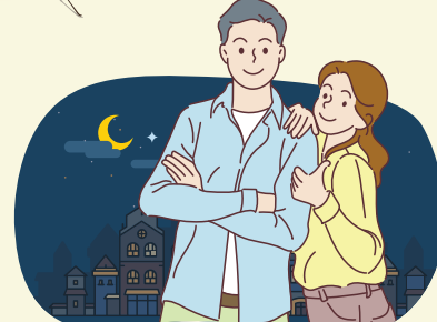
야간활동 시 밝은색의 긴옷 착용