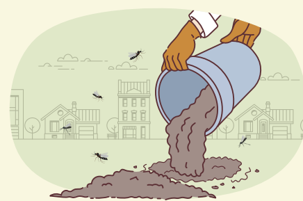
고인물 등 모기 서식처 제거