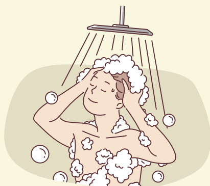
야외활동 후 샤워