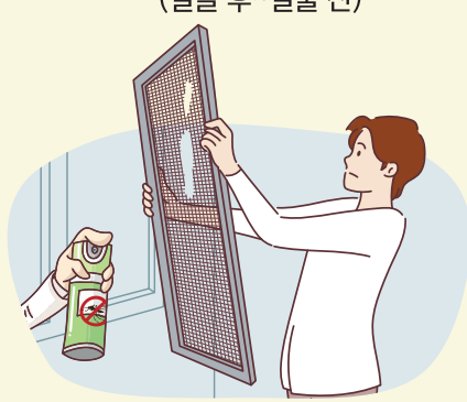
가정용 살충제 사용 및 방충망 정비